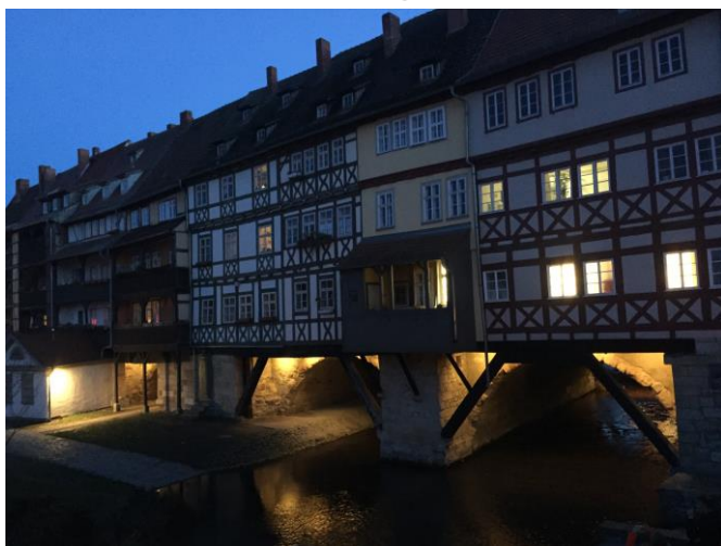
Krämerbrücke, Erfurt – Europas längste durchgehend mit Häusern bebaute Brücke